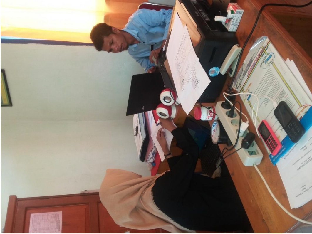
Wawancara dengan Sekretaris Desa