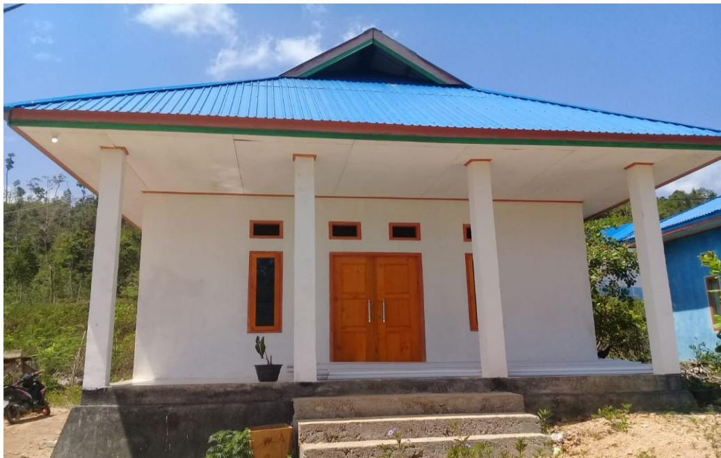
Bangunan Sanggar PKK