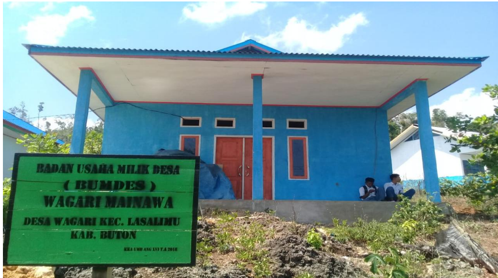
Pembangunan fisik : Bangunan Lanjutan Kantor Bumdes